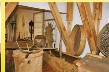
Saatse Seto Muuseum