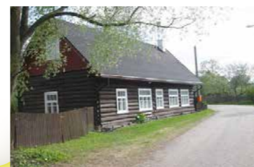
Obinitsa Seto muuseum