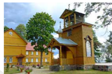
Raja vanausuliste palvela

Vanausuliste kogukonnas peavad paljud patuks habeme ajamist, suitsetamist ja kohvi joomist. Erilise elamuse pakub osalemine vanausuliste elava künlatule, omapärase liturgia, monoodilise kirikulaulu ja kellamänguga jumalateenistustel. Ärge jätke kasutamata võimalust kohalike toidukohti proovida ja selle kandi kala ning sibulaid kaasa osta!