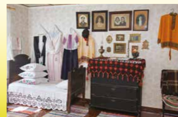
Kolkja vanausuliste muuseum