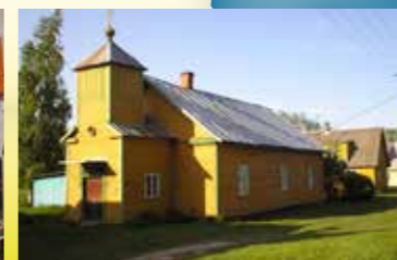
Vanausuliste kirik Piirisaares